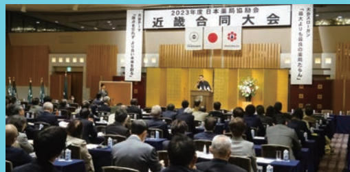
3階「源氏の間」にて対面で開催される