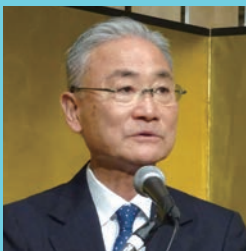
来賓祝辞 北尾哲郎日邦メーカー会会長