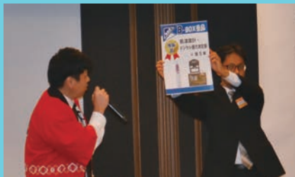
盛り上がった抽選会