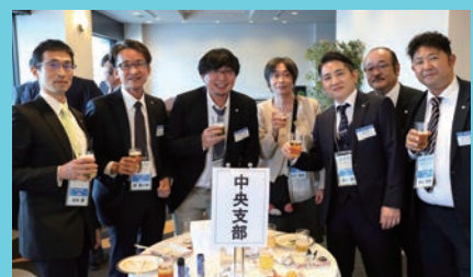
合同大会を担当された東京中央支部の先生方