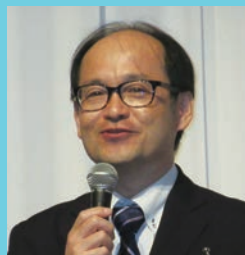
特別講演 帝京大学医学部病院教授 渡邊清高先生