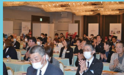
4年ぶりの集合開催