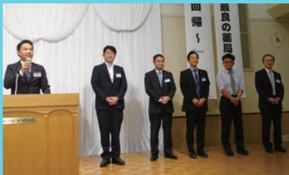
推販アワー 各支部推販部長