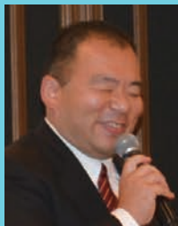
閉会の言葉 広本篤岡山支部長