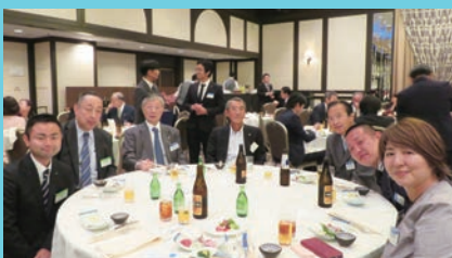
コロナ後、初の対面での懇親会は盛り上がった