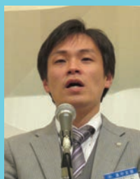
協励会歌・協励十訓 指揮 的場勸道中支部 青年部長